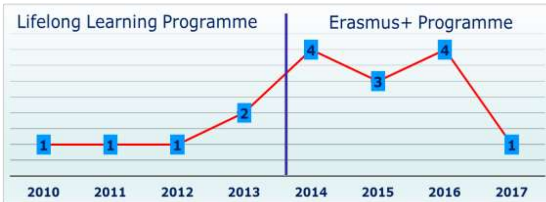
Figura.1. Dinamica proiectelor Jean Monnet realizate de universitățile din R. Moldova

aprofundarea cunoștințelor despre politica, viața economică, socială și culturală a Uniunii Europene.